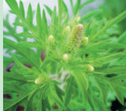
Im Juli werden Blütenstände sichtbar, die frühen Pflanzen beginnen zu blühen.