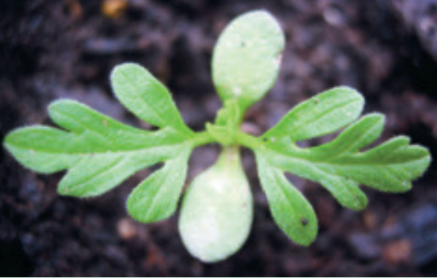
Keimpflanzen sind ab Mitte April bis Anfang September vorhanden. Die Hauptkeimzeit dauert von Mitte April bis Mitte Juni; nach einer Bodenbearbeitung laufen bis Anfang September neue Keimlinge auf.