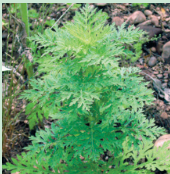
Im Juni bilden die Pflanzen Seitentriebe und wachsen in die Höhe.