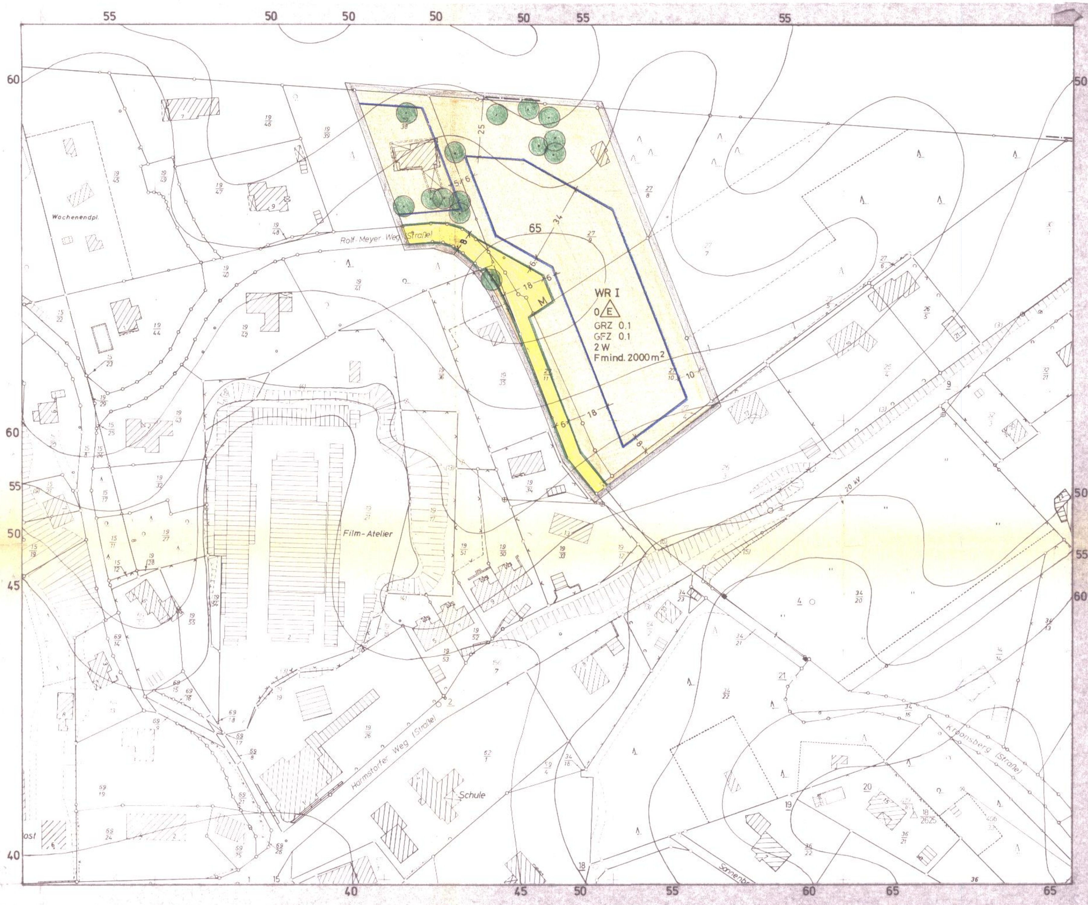
ÜBERSICHTSSKIZZE MASST. 1 : 25000